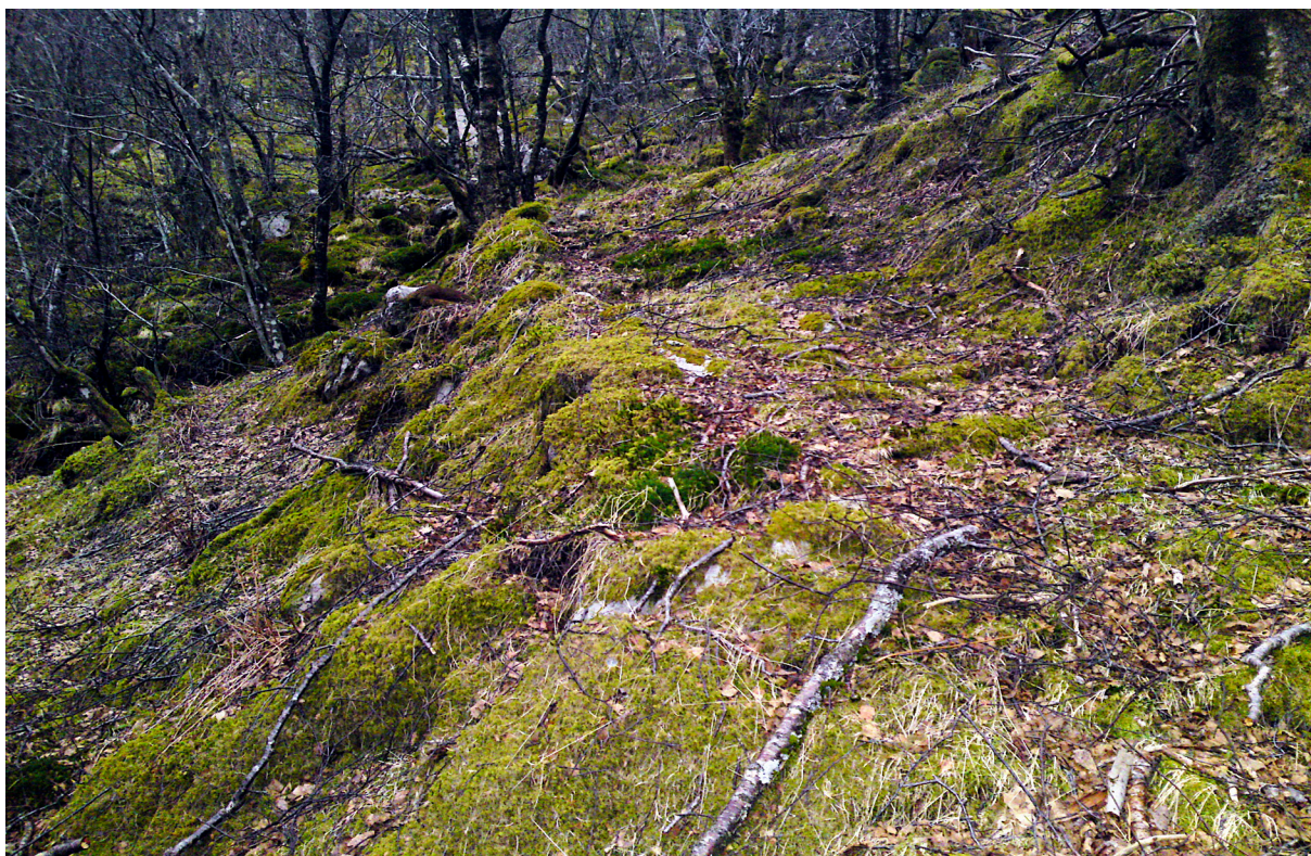
Gammel stølsveitrasé i Slette-bakkjen, like ovenfor leet ved Norddalsopså. Veien er her oppbygd med steinrekker på ned-siden. Her er den gamle stitraséen helt tydelig. Mange steder er traséen utrast eller utydlig fordi stein har veltet ned. Andre steder har bekker gravd. Enkelte steder får en inntrykk av at fjellveien for i tida var en blanding av 'vei' og en smal sti mellom steinblokker. Foto 2016.