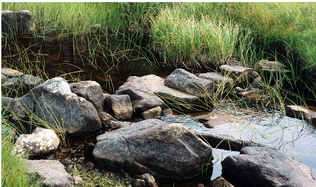
Nokså langt nede i Stølsbekken finner en disse gangsteinene, delvis nedrast nå. Det er usikkert hvem som laget dem og når de ble laget. Såvidt jeg vet har de ikke vært i bruk de siste 60 år. Kryssing av bekken her tilsier en litt annen trasé fra Stora-myra opp til Hålandsstodln. Kanskje ble den laget for at gjeterne som skulle drive kyrne hjem til stolen mot kveld skulle kunne følge buskåpen uten å måtte vasse? Kyrne gikk eller svømte over ved utløpet av bekken. Stedet her heter Sæme - med trykk på første stavelse. Foto 1997.