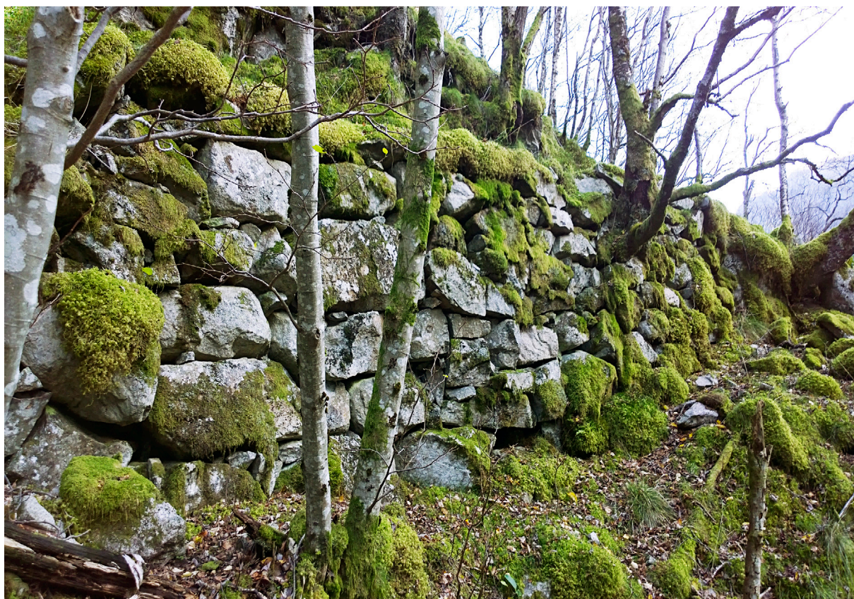
Stolsveien mellom Heltå og Streide. Veimuren er her omkring 1,5 m høy. Foto 2011.