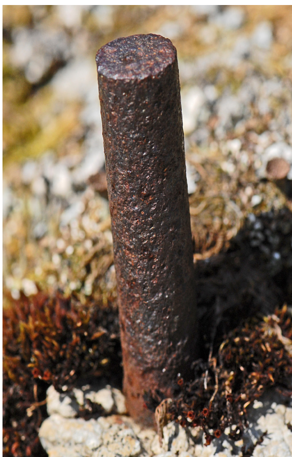
Det finnes omkring 20 slike jernbolter i stolsveien. Minner om forberedelse til kraftutbygging. Foto 2011.