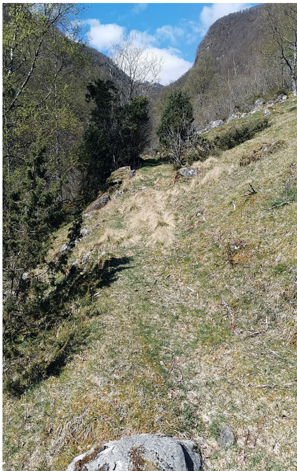
Gamle stolsveien fra Fantorå og innover. Foto 2016.