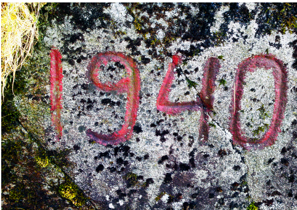
Da arbeidet med utbedring og omlegging av stolsveien gikk mot slutten våren 1940, bogg Dagfinn Haaland inn dette årstallet som et minne over arbeidet som nå var ferdig. Tallene står i en loddrett bergvegg like innenfor Urbekke. Foto 2016.