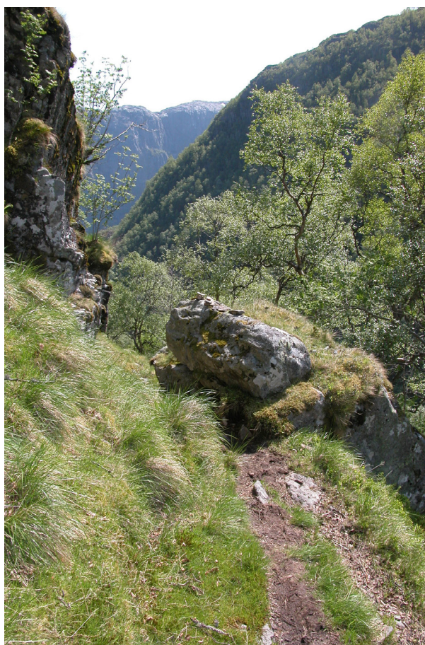
Stolsveien i Kleivane med Kistå. Foto 2011.