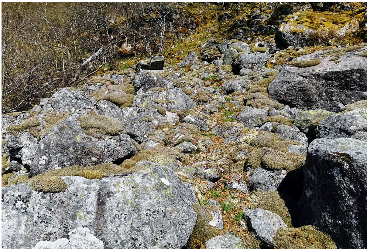
Gamleveien et stykke nedenfor Leet. En veipassasje er ryddet gjennom ura. Foto 2016.