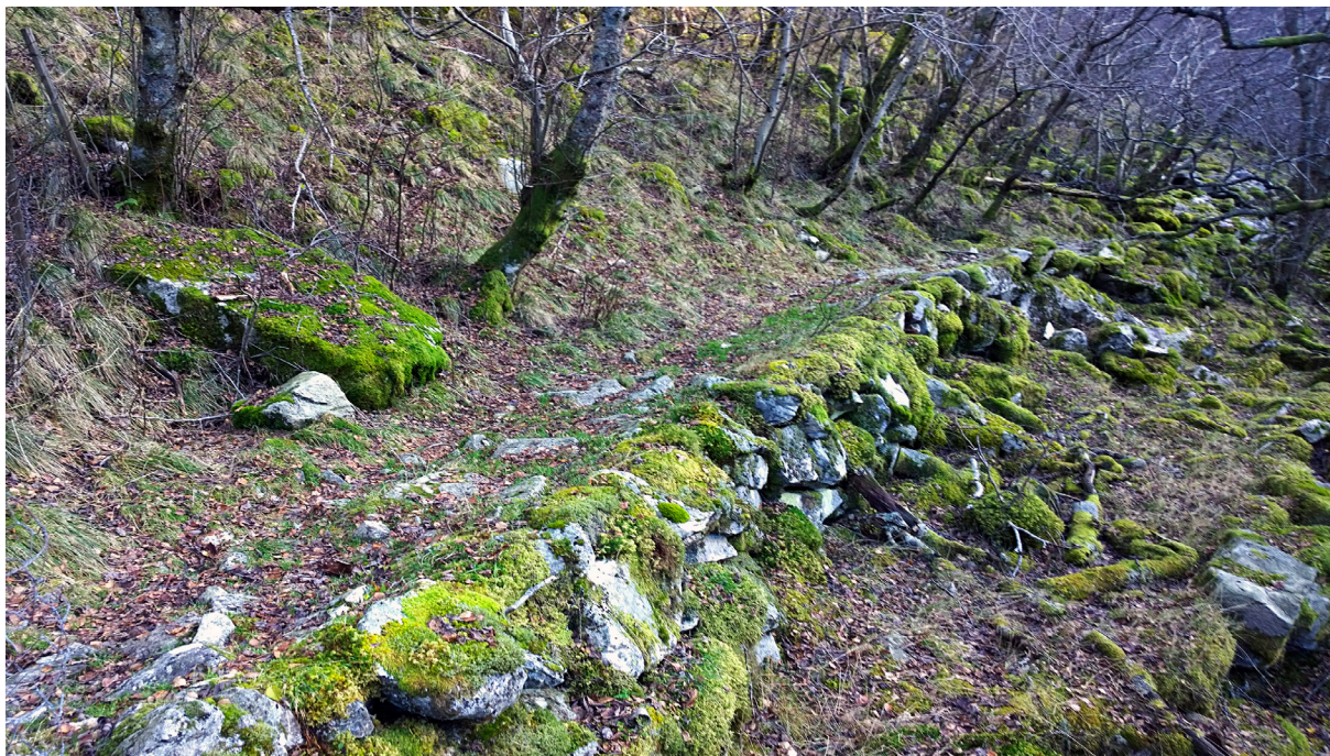
Stølsveien like nedenfor Leet. Kanskje noen aner at det kommer en eldre veitrasé opp fra høyre, nesten parallelt med dagens vei. Denne eldre veien går sammen med dagens stølsvei like for Leet. Foto 2011.

Stølsveien opp Norddalen starter ved det gamle markaleet nederst på Slettå. Følger så steingarden vestover forbi Taksteidn (vekkskutt i 1950-årene) med Svartops på høyre side. Videre langs Kalvahaien og Bennarensle nesten opp til Nordalsopså. Strekingen fra Tagsteidn til Nordalsopså heter Klomrene. Fra grinda her videre østover på nedsiden av Slette-bakkjen opp til Svartops. Her svinger veien nordvestover ca 300 m til Leide og Store-steidn. Herfra videre oppover og nordover forbi Fantorå opp til Leet, like under Hedlertødne. Fortsetter så oppover til Urbekk. Videre nordover i rein gråorskog til Heltå. Strekingen fra Heltå til Streide kalles File-bakkjen. Så opp brattbakken Streide til begynnelsen av Kleivane. Midt i Streide ligger Kvilesteidn. Kleivane starter øverst i Streide og fortsetter forbi Kistå og Svinagaren til Brekkå (Brekkeløå). Stien videre går langs Vene-bakkjen forbi Klobben og et stykke oppover langs Stølsbekken. Krysser bekken og snor seg opp til Hålandsstødn. Stødn ligger på Finn-bakkjen, 507 moh. Strekingen fra Håland til stødn er ca. 3,4 km.