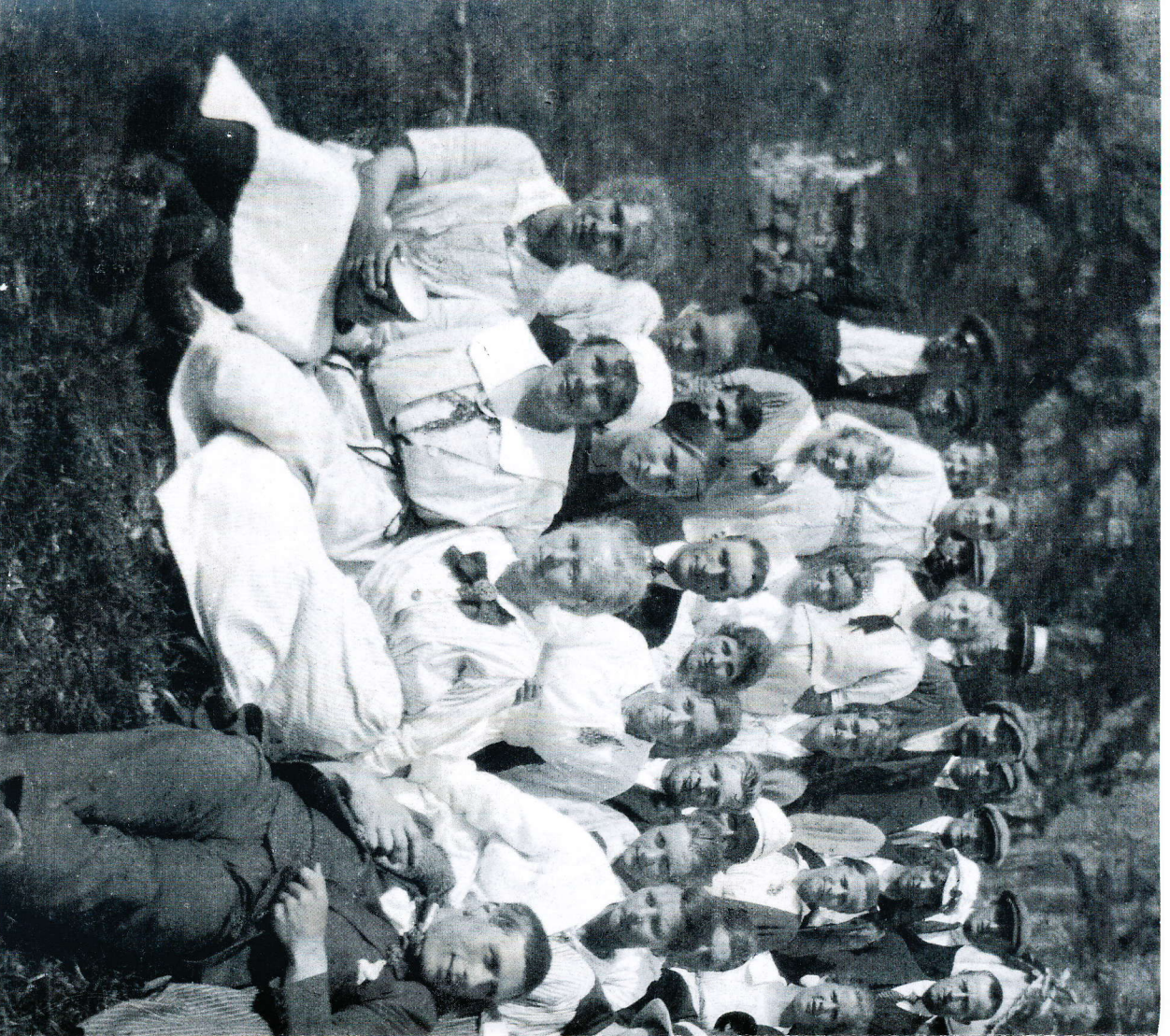
Søndagsstevne på Hålandstølen sommeren 1920. Nærmere 70 personer, både ungdommer og voksne, har tatt den tunge veien opp fra gardene i Frøsfjord og Espedal. Sannsynligvis er det også en del tilreisende på denne samlingen. Antallet deltakere er imponerende, likeens undres vi i dag over antrekket: Nænn ofte i dress, vest og slips; kvinnene i sine lange, lyse kjoler. Disse stolsstevnene hadde nok ulike formål og