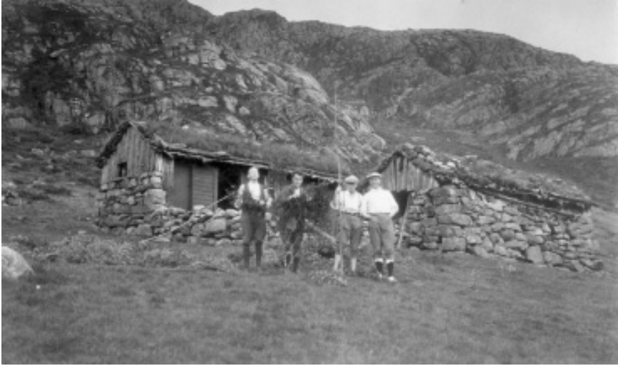
Hålandsstølen ca. 1925