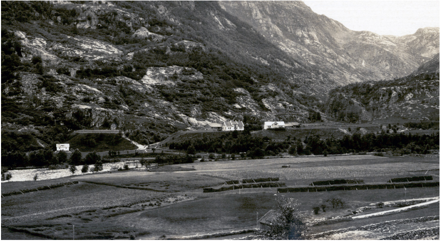
Håland 1923 .